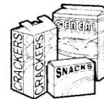
Boxboard, cake, cereal, beer and pop boxes, etc. (Carton)