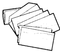
Junk Mail (Correo no deseado)