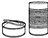
Tin or Steel Cans (Latas de hierro u hojalata)