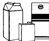
Milk, soup, broth cartons and juice boxes- Rinse and remove caps (Envases de carton de lacteos y jugos)

No incluya residuos de alimentos: peliculas:bolsas o envolturas de plastic: vasos o recipients de uncel no basoda.