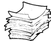
Office Paper (Papel de ofician)